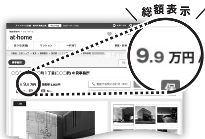
▲不動産情報サイト アットホーム 物件詳細画面

A 税別・税込での価格および 金額表示が混在しないよう、 「総額表示」で統一して おります。